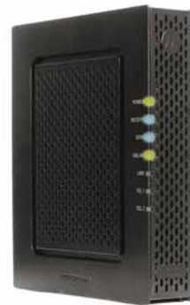
MOTOROLA SBV 6120 ED 3.0

Služba je poskytována ode dne, kdy technik úspěšně zprovoznil koncové místo (tzn. účastnickou zásuvku ve Vašem bytě) nebo v den, kdy Vám dodal samoinstalační balíček, pokud je koncové místo již zprovozněno.