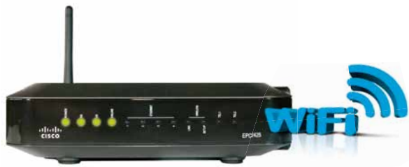
CISCO EPC 2425 ED 2.0 WiFi