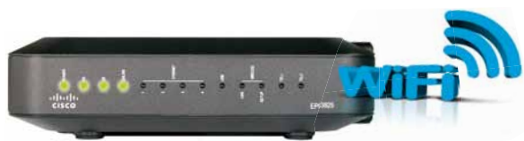
CISCO EPC 3925 ED 3.0 WiFi