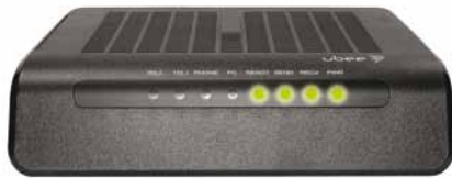
UBEE EVM 3206 ED 3.0