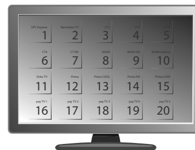
Ukázka řazení programů od výrobce TV přijímače Philips

Po úvodním 10denním období budou dostupné programy podle smluvně sjednané programové nabídky. Řazení programů je dáno výrobcem TV přijímače.