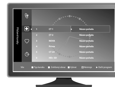
Ukázka řazení programů od výrobce TV přijímače Samsung